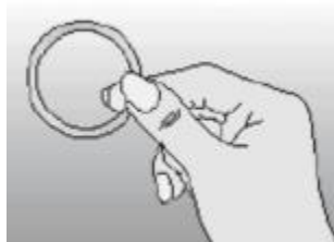
Rycina 1 Wyjąć system z saszetki