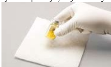
Rysunek A: Należy pewnie postukać w celu wymieszania