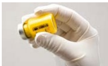
Rysunek C: Należy intensywnie potrząsać fiolką

W przypadku spienienia się zawiesiny należy pozostawić fiolkę do czasu, aż piana zniknie. Jeśli produktu nie zużyto natychmiast, należy intensywnie wstrząsnąć w celu odtworzenia zawiesiny. Po rozpuszczeniu produkt ZYPADHERA w fiolce pozostaje stabilny do 24 godzin.