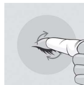
Rysunek 2: Oczyszczanie powiek i rzęs

Delikatnie masować powieki małymi, kolistymi ruchami, usuwając wszelkie zanieczyszczenia, wydzielinę lub kosmetyki.